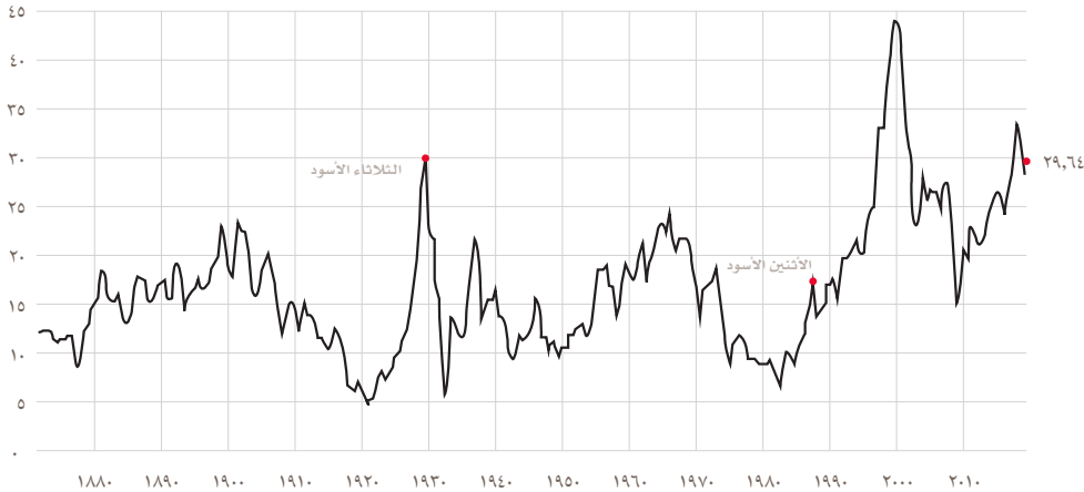
مكررات ربحية شيلر التاريخية

من المرجح أن تكون الأصول مئّنة بأعلى من قيمتها الحقيقية، غير أنه من المتوقع أن يكون تأثير أي تصحيح سلبى للاقتصاد محدوداً، وذلك بسبب انخفاض حجم ديون القطاع الخاص وتشديد الرقابة المالية.